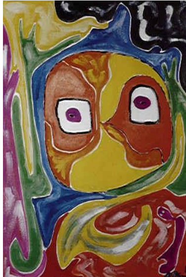
Janushoved / R Pind